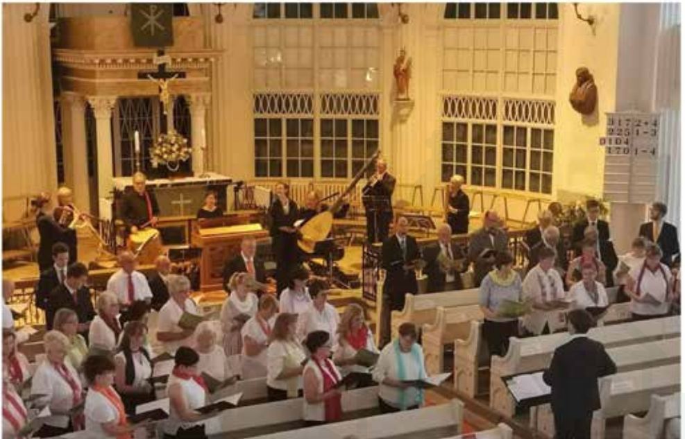
Rückblick Singt Schütz am 3.7.

Der Eintritt ist frei, eine Kollekte wird am Ausgang erbeten.