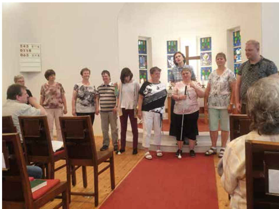
Rückblick auf den Gottesdienst anlässlich des Sehbehindertensonntags am 12.6. in Affalter