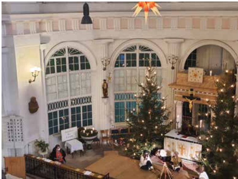
Christvesper mit Krippenspiel in Löbnitz