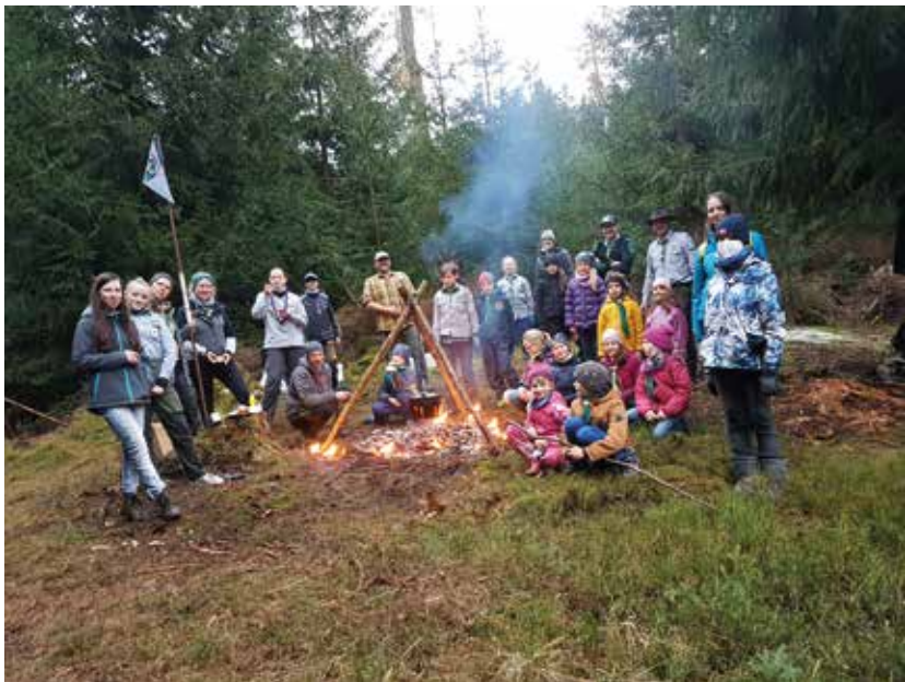
Pfadfindertreffen im November 2021 auf dem neuen Lagerplatz im Kirchenwald

Veranstaltungen für Kinder und Jugendliche sind nach der ab 14.1. geltenden Coronaschutzverordnung mit Regelungen wie im Schulunterricht möglich (Abstand und Mund-Nasen-Bedeckung).