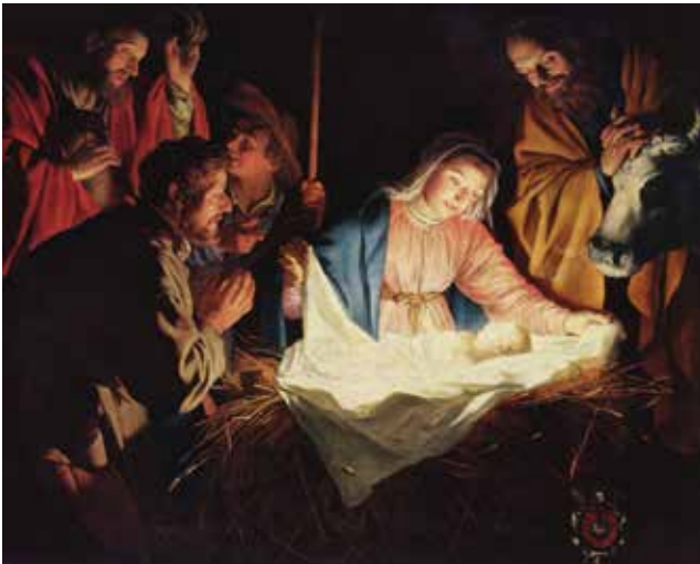
Gerrit van Honthorst 1622