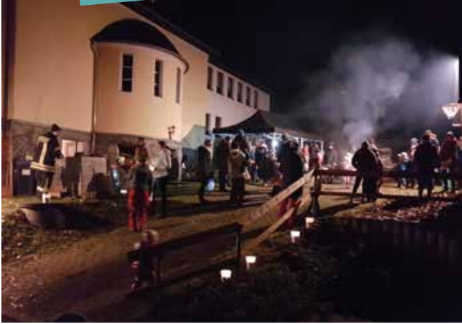
Martinstag in Affalter