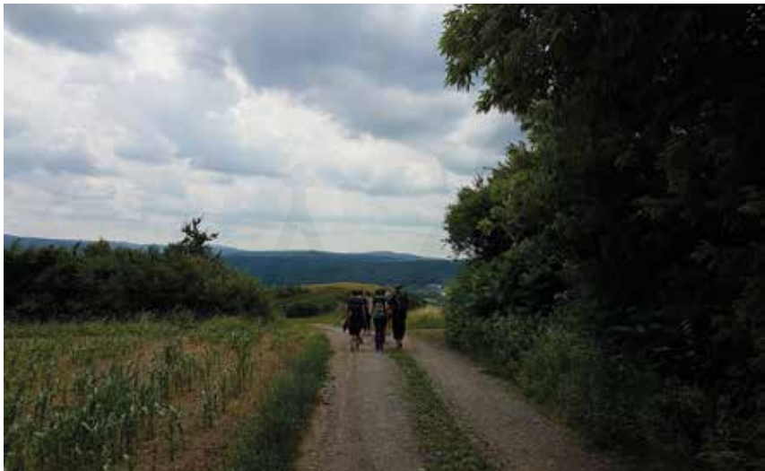
Pilgerwanderung am 23.6.