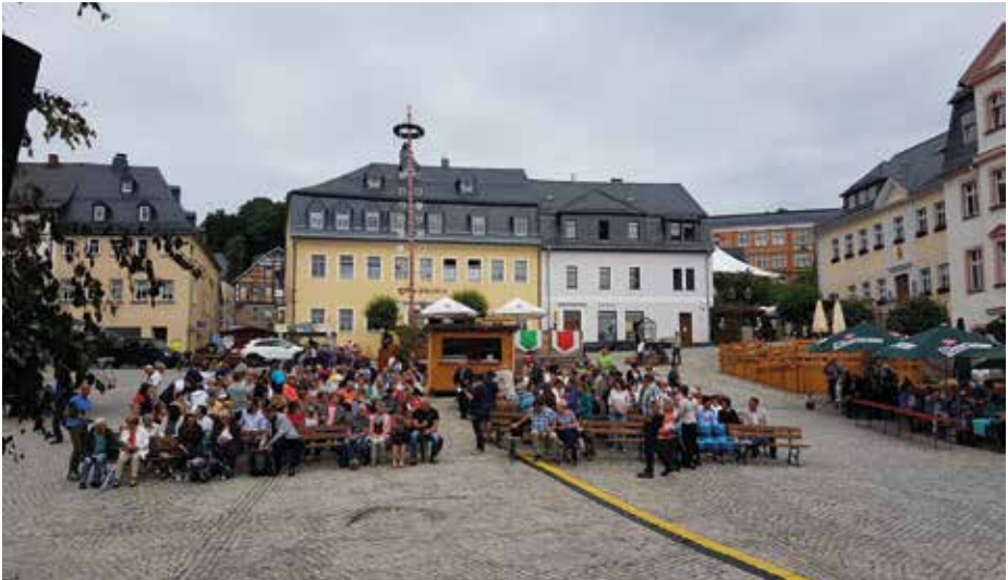
Salzmarktgottesdienst am 16.7.2019 - pünktlich 10 Uhr war der Regen vorbei