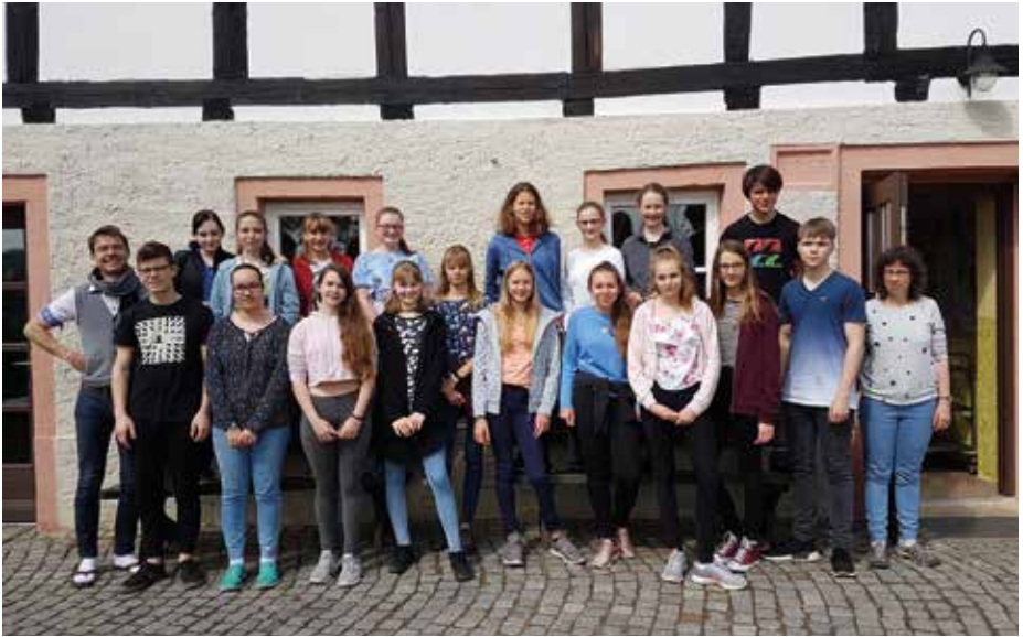
Konfi-JG-Freizeit in Zehren