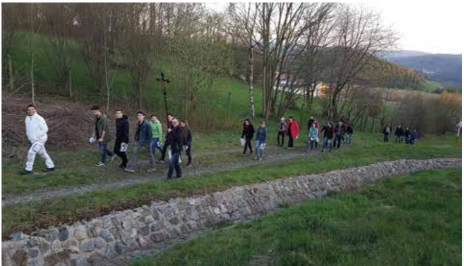
Kreuzweg in Alberoda