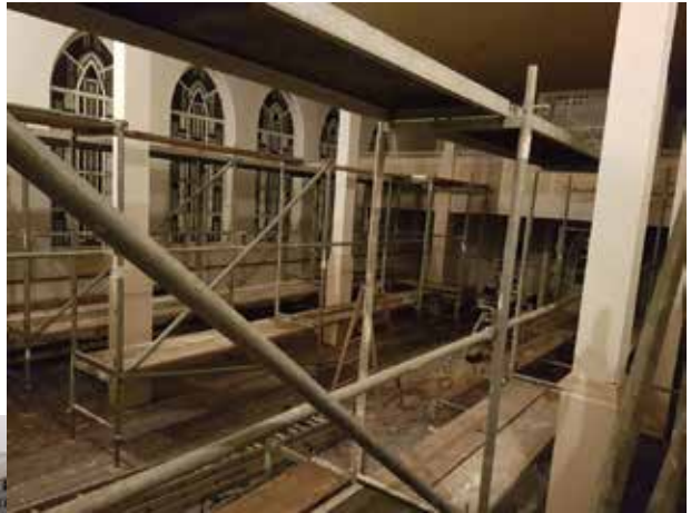
Bilder von der Bauphase Januar - März