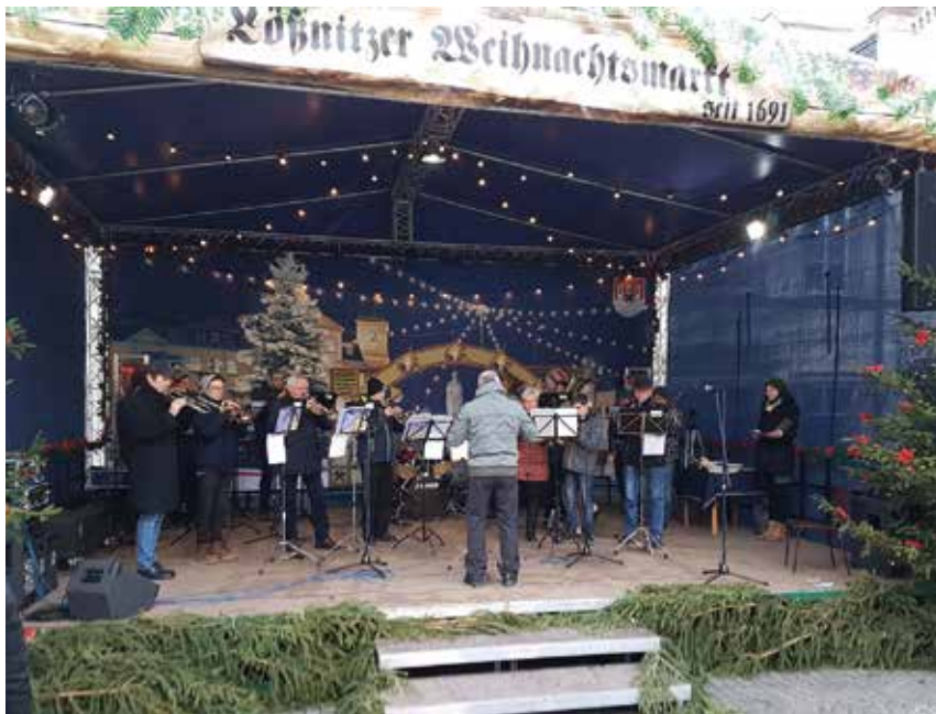
Pfrn. See- kamp-Weiß mit den Bläsern der LKG auf dem Lößnitzer Weih- nachts- markt