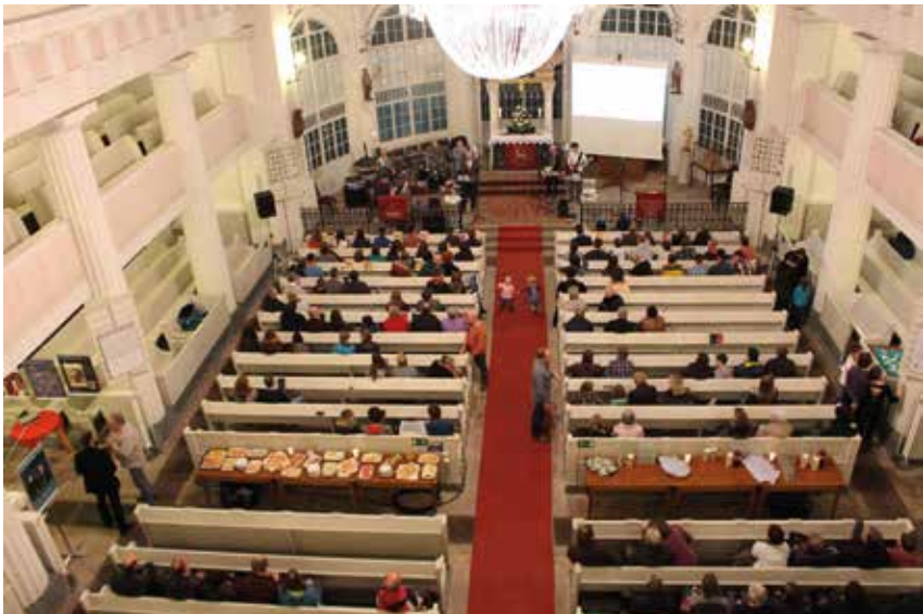
Rückblick Craftword Gottesdienst