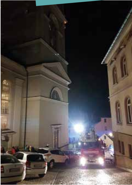
Jahresabschlussübung der Freiwilligen Feuerwehr Lößnitz