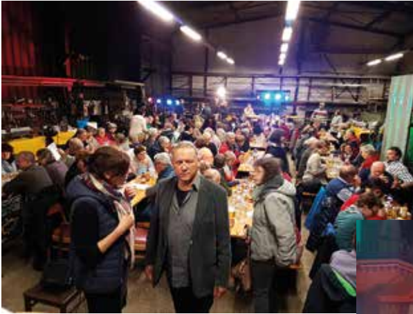
Ehrenamtlichen-Dankesfeier am 26.10. in der Schlosserei Seinige